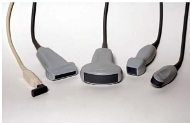
Vhodné pro většinu běžných sond